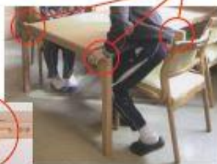
手すりの拡大写真