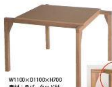
W1100×D1100×H700 素材：ラバーウッド材 天板：メラミン